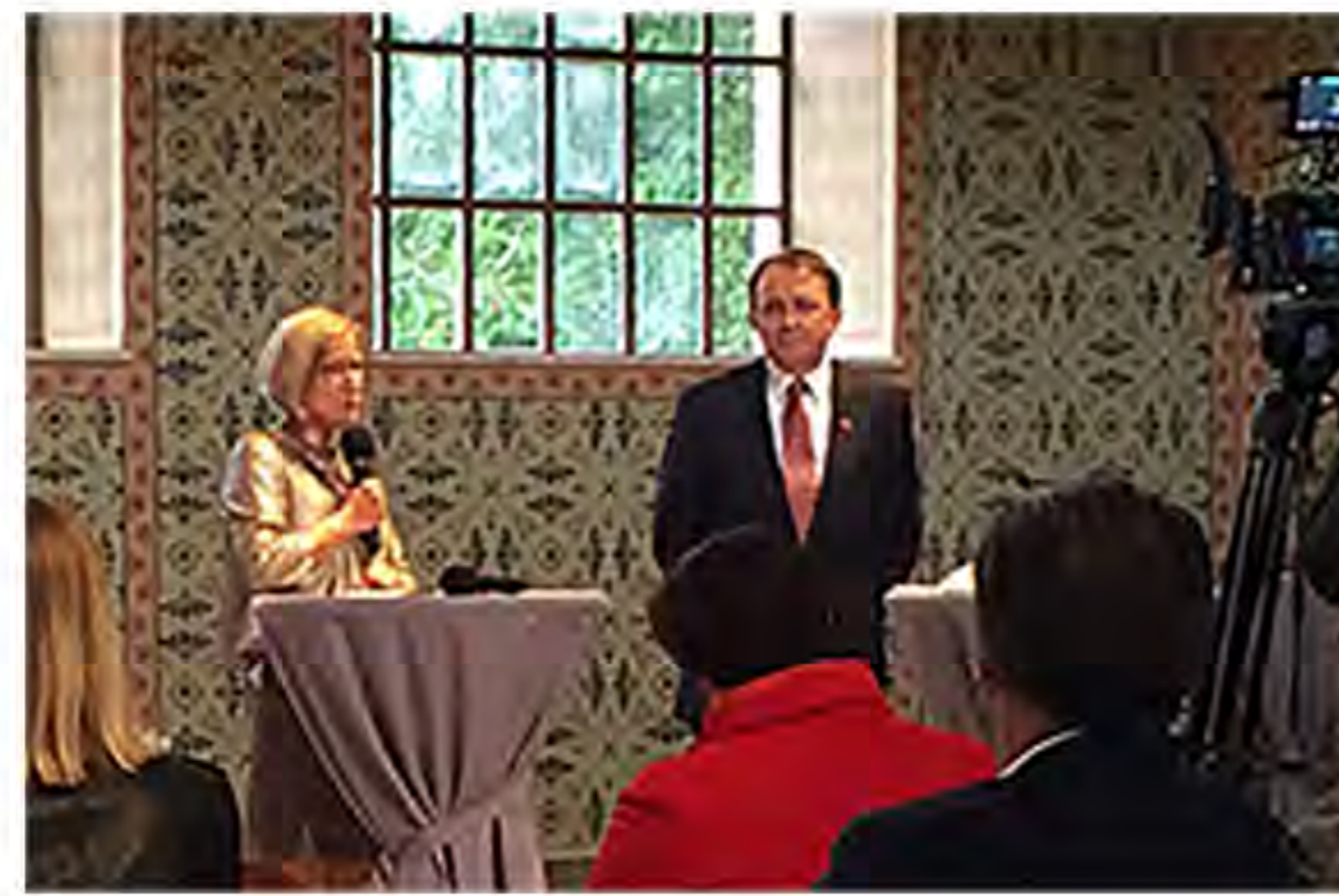
EU-weiter offener Wettbewerb während der Pandemie